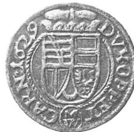
72) Krejcar, Karel z Lichtenštejnu, mincovna Opava, 1629, Ag

něny v roce 1659 na principu unifikace drobné mince. Cizí, uvnitř státu obíhající (méněhodnotná) mince byla radikálně devalvována (přibližně o 25 %). Stabilita měnové soustavy po další léta 17. a první polovinu 18. století neznamenal naprosté fixování vnitřní hodnoty ražených mincí, třebaže se o to panovník ve vlastním zájmu soustavně staral vydáváním devalvačních předpisů, které měly zabránit pronikání cizí mince do země. Měnový vývoj v německých zemích, který byl odlišný pokud šlo o mincovní jednotku, soustavně působil na strukturu měny užívané v habsburském soustátí a jeho vliv byl tím větší, čím rychleji vzrůstaly politické kontakty Habsburků s německými státy. Provedení měnové reformy se stávalo takřka historickou nezbytností. (Viz tab. IV, s. 469)