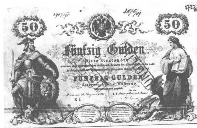
77) 50 zlatých, bankovka, 1866, Rakousko

Souběžně se děly v rámci celní unie pokusy o zavedení jednotné obchodní zlaté mince (zlaté koruny a půlkoruny), která by byla snadno převoditelná na stříbrný nominál ve všech členských zemích unie, v Rakousku např. zastával zavedení zlatého standardu v letech 1855/1856 ministr financí K. L. Bruck. Vídeňský mincovní kon-