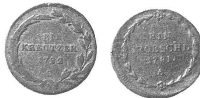
75) a/ Krejcar, Josef II. (1780–1790), mincovna Praha, 1782, Cu, rub b/ Grešle, Josef II. (1780–1790), mincovna Vídeň, 1781, Cu, rub

Kurs šajnů sice dočasně stoupl (1812), ale záhy opět klesal. V této situaci se stala po francouzském vzoru nástrojem sanace finanční soustavy v císařství tzv. Privilegovaná národní banka rakouská, založená jako akciová společnost v roce 1816. Jejím hlavním úkolem bylo sjednotit měnu konvenční a platební prostředky, obíhající v rakouském císařství, a to výkupem šajnů, které měly být nahrazeny bankovkami. Tento obtížný ekonomický úkol byl splněn dalším vyrovnáním, tentokrát na 40 % v roce 1817. Znamená to, že hodnota kreditních platidel klesla v letech 1811 až 1817 na 8 % vzhledem k počátečnímu datu. Stahování šajnů postupovalo velmi pomalu a navíc se stát znovu u banky zadlužoval, takže v roce 1847 existovalo jen třetinové krytí bankovek kovem.