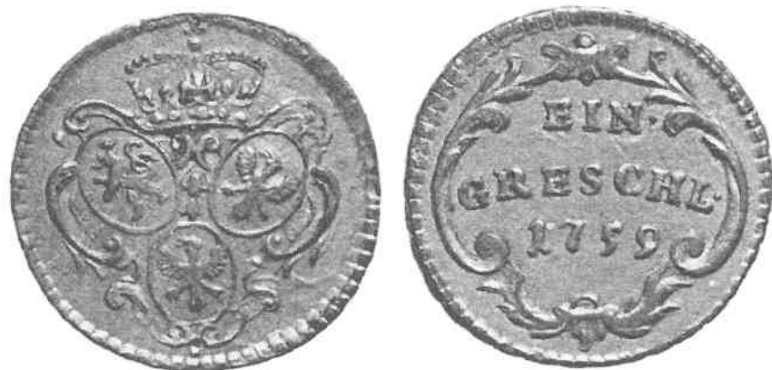
73) Grešle, Marie Terezie (1740–1780), mincovna Praha, 1759, Cu, líc a rub