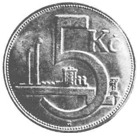
79) 5 Kč, Československá republika, mincovna Kremnica, 1925, rev. strana

Nestabilita měny se projevila už na počátku roku 1939, kdy bylo změněno označení jednotky měny – Kč – na prosté K, které bylo pak nadále užíváno i po zřízení Protektorátu Čechy a Morava 15. března