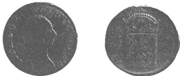
74) a/ Krejcar, Josef II. (1780–1790), mincovna Praha, 1782, Cu, líc b/ Grešle, Josef II. (1780–1790), mincovna Vídeň, 1781, Cu, líc

měna (Einlösungsscheine, v českých zemích označována jako „šajny“). Stát provedl vyrovnání inflačních bankocetlí se šajny redukcí jejich hodnoty na jednu pětinu (tj. na 20 %). Za 5 zlatých v bankocetlích se tedy dával 1 zlatý vídeňské měny (Wiener Währung, zkratka W.W.). Přitom však bylo stanoveno, že všechny starší závazky (dluhy aj.) musely být splaceny podle hodnoty peněz v době, kdy vznikly, a to pochopitelně v šajnech. Toto ustanovení postihovalo především chudší společenské vrstvy.