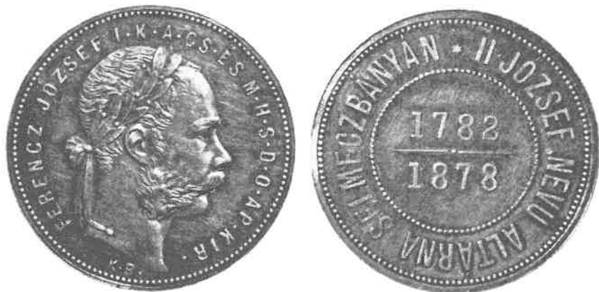
78) Zlatník, František Josef I. (1848 – 1916), mincovna Kremnica, pamětní mince, Ag

Korunová měna (1892 – 1918): Roku 1892 byla zavedena korunová měna, založená na zlatém standardu, která se v praxi projevila ražbou zlatých a stříbrných mincí, jakož i emisí bankovek vyšších nominálů, směnitelných za kov. Mincovní a měnovou jednotkou se stal jeden kilogram zlata. Z mincovního kilogramu zlata (0,900 zlata + 0,100 mědi) mělo být raženo teoreticky 2952 korun (označení K).